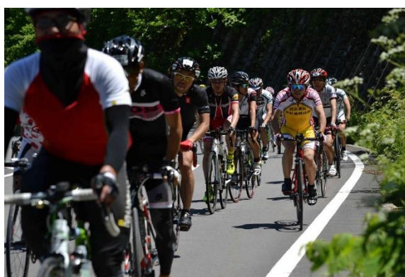
ロングコース走行 (相倉付近)