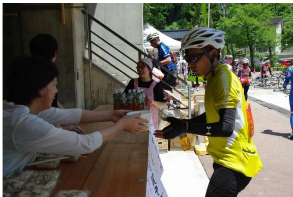
ロング昼食ポイント (利賀)