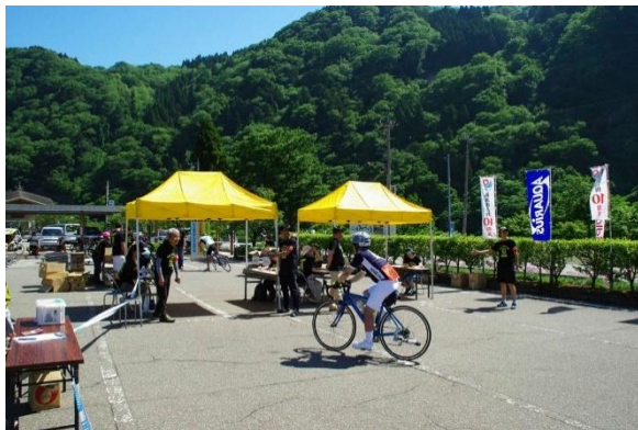
チェックポイント (水記念公園)