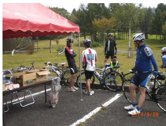
チェックポイント休憩中